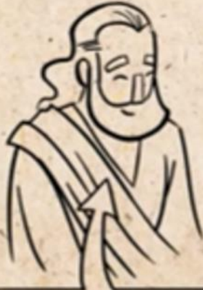
MODEL READER OF PROVERBS

I AM A BRUTE AND HAVE NO WISDOM (30: 2-3)