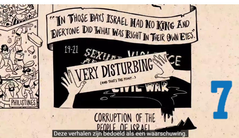
CORRUPTION OF THE PEOPLE OF ISRAEL