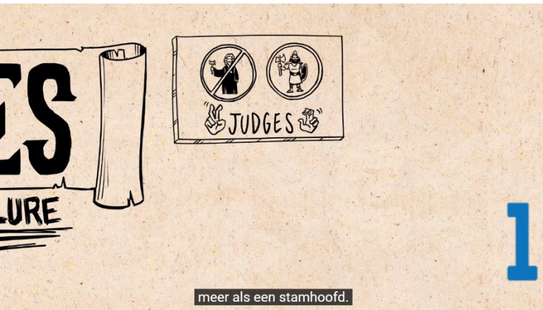
meer als een stamhoofd.