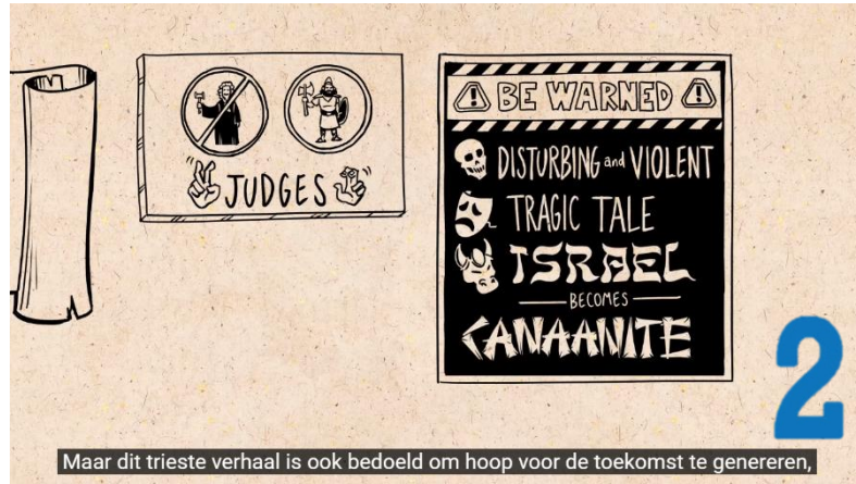
Maar dit trieste verhaal is ook bedoeld om hoop voor de toekomst te genereren.