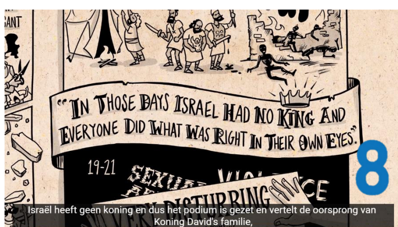
Israël heeft geen koning en dus het podium is gezet en vertelt de oorsprong van Koning David's familie.