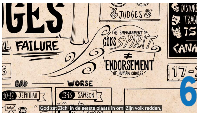
God zet Zich in de eerste plaats in om Zijn volk redden.