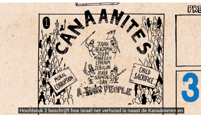
Hoofdstuk 2 beschrijft hoe Israël net verhuisd is naast de Kanaänieten en